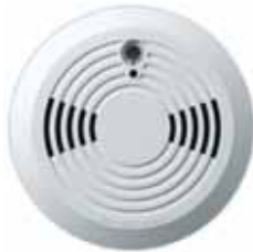
Detector de Humo (SD738) Alcance: 30m (100ft)* Fabricado por EVERDAQ (Taiwan)†