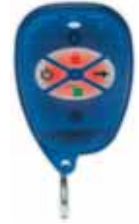
Control Remoto Magellan con luz de fondo (MG-REM1) Alcance: 30m (100ft)*