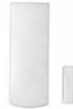
Contacto de Puerta de Largo Alcance (MG-DCT1) Alcance: 35m (115ft)*