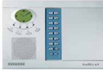
Sistema Inalámbrico Todo en Uno (MG-6060)