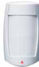
Óptica Doble Digital Infrarrojo de Alto Rendimiento (Inmunidad Real contra Mascotas de 40kg /90lb) (MG-PMD75) Alcance: 35m (115ft)*