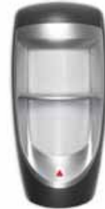
Óptica Doble Digital Infrarrojo de Rendimiento Superior para Exteriores (Inmunidad Real Contra Mascotas de 40kg /90lb de Peso) (MG-PMD85) Alcance: 35m (115ft)*